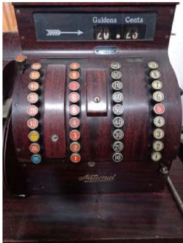
11. Het museum schafte een nieuw kassasysteem aan voor de registratie van de omzet. Afgelopen jaar werd echter ook een oud kasregister verworven voor de collectie.