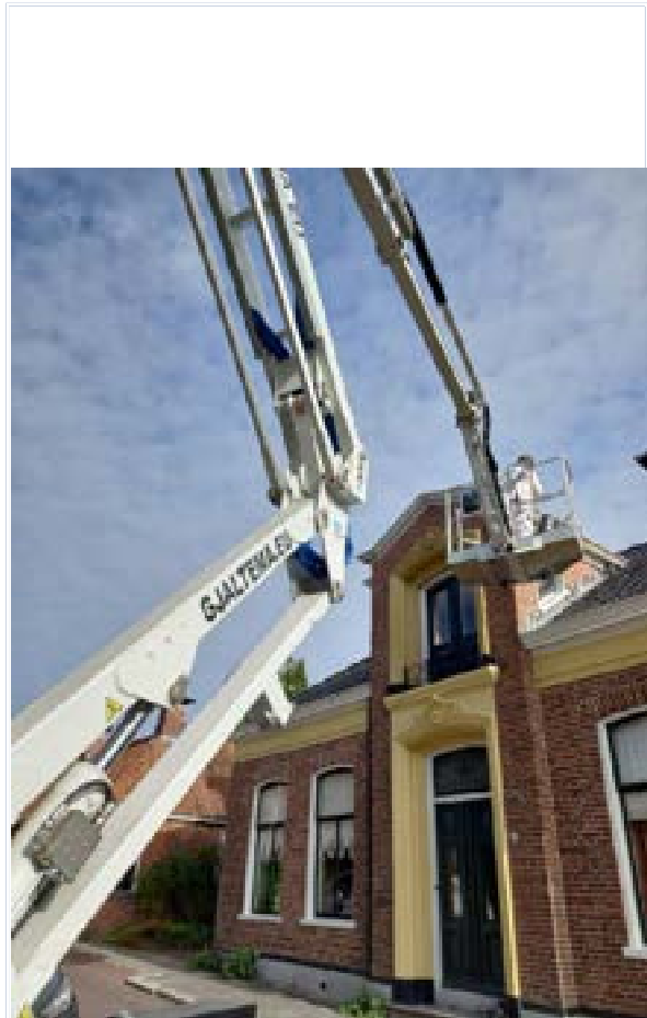
8. in het kader van het meerjarig onderhoud werd De Veeartsenij dit jaar opnieuw geschilderd.

Het aantal vrijwilligers bleef globaal gelijk,