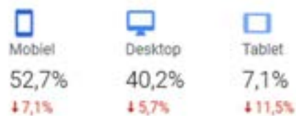
10. de website werd met name via een mobiele telefoon of een desktop geraadpleegd.