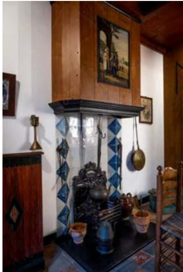
2. De bestaande inrichting van het Gasthuis is in december 2022 fotografisch geregistreerd

Met middelen van het Mondriaan Fonds en steun van een particuliere organisatie heeft het museum een tijdelijke aanstelling voor een collectiemedewerker gerealiseerd. Het doel van deze aanstelling is de collectieregistratie beter te