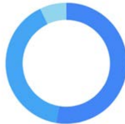
Sessies per apparaat

Het museum beschikt nog altijd over zijn website, een facebookaccount en een instagrapagina. De laatste twee worden met grote regelmaat vernieuwd. De website wordt