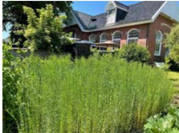
19. Dit jaar werd op het terrein onder andere vlas verbouwd, een oud gewas dat in Noord-Groningen aan een terugkeer bezig is.

In 2022 is stevig gewerkt aan het inlopen van achterstanden in het onderhoud van de