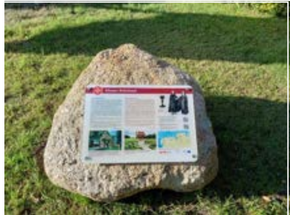
5. het paneel over het Johannierter Klooster Bokesch (D).

De bezoekerscijfers over 2022 vallen tegen. Ze zijn lager dan 2019, het laatste jaar dat corona uitbrak, maar ook lager dan in 2021. In dat jaar werden de maanden waarin het museum noodgedwongen gesloten was, gecompenseerd door een uitzonderlijk goede zomer. Dat verschijnsel bleef dit jaar uit, ondanks een herhaling van de landelijke promotiecampagne die samen met de andere Waddenmusea werd ontwikkeld. Ook de vergelijking met het tienjarig gemiddelde valt ongunstig uit.