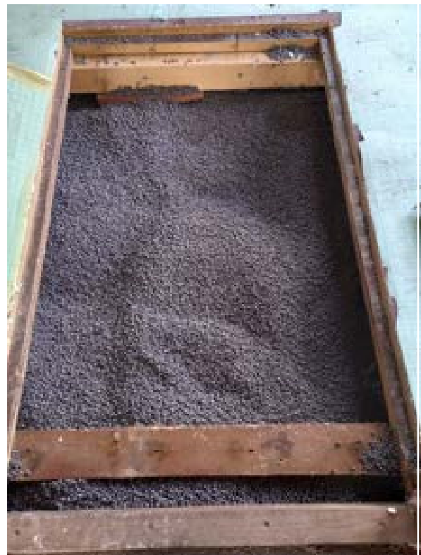
18. isolatiemateriaal onder de vloer van de woning Oosterstraat 35.