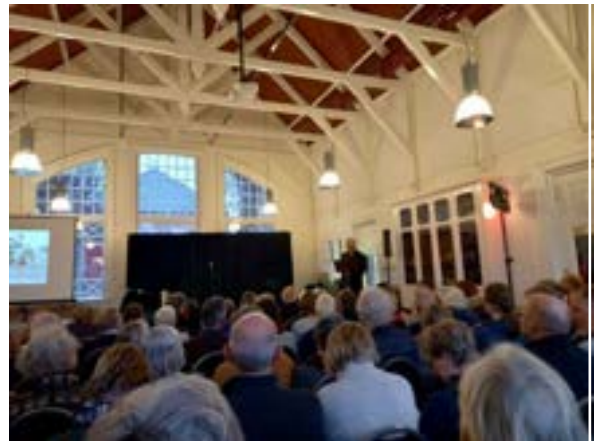
6. een volle zaal bij de voorstelling van het Verhalen Cabinet.