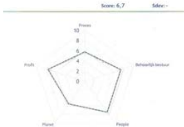
17. grafische weergave van de score van het museum op de Milieubarometer.

Voor het museum was de belangrijkste reden om deel te nemen aan het Koploperproject, de al langer levende zorg over het energieverbruik en de wens om het gebruik van fossiele energie zoveel mogelijk terug te dringen. Een