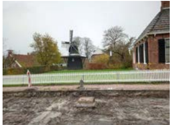
15. na jaren van voorbereiding werd in het najaar van 2022 de Oosterstraat opengebroken voor vernieuwing van het wegdek. Hier de straat ter hoogte van de eenkamerwoning.

Daarnaast was de directeur in 2022 op persoonlijke titel actief als adviseur van het Mondriaan Fonds en voorzitter van de Beoordelingscommissie Historisch Railmaterieel van Historisch Railvervoer Nederland.