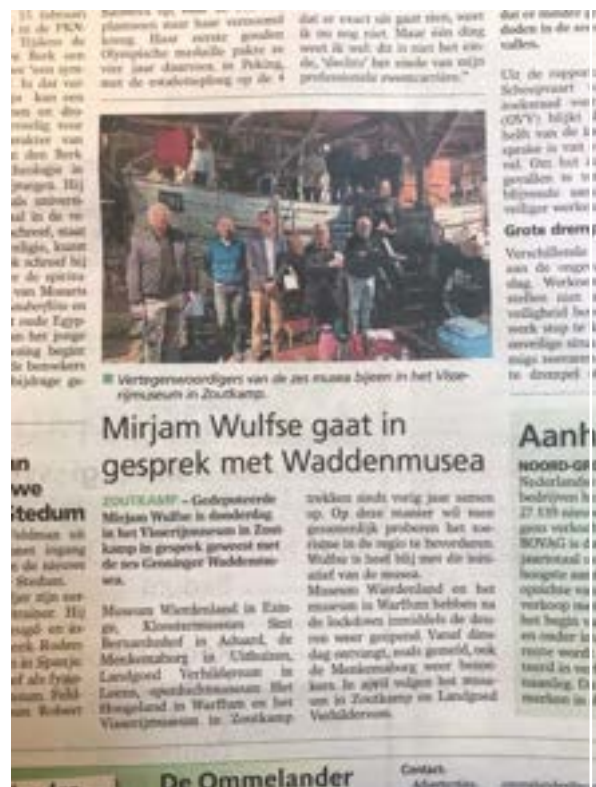
12. de Waddense musea hadden een bijeenkomst met gedeputeerde Mirjam Wulfse in Het Visserijmuseum in Zoutkamp

Sinds twee jaar werkt het openluchtmuseum samen met vijf andere musea in de regio onder de noemer “De Waddense Musea”. Kern van deze samenwerking is het verhaal van 3000 jaar leven aan de Waddenkust, waar alle musea een bijdrage aan leveren. Het motto luidt: “Bezoek ons allemaal, dan hoor je het hele verhaal”. Evenals vorig jaar werd ook in 2022 een landelijke promotiecampagne in de zomermaanden gehouden. Een spotje op landelijke TV en op Radio 1 en 4, lantaarnpaalaffiches in verschillende gemeenten en promotie op regionale media zorgden voor korte maar intensieve reclame in de zomermaanden.