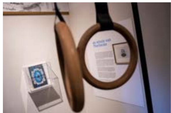
4. beeld uit de tentoonstelling Paard. Bok. Brug & Ringen