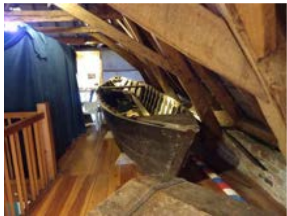
3. de haringboot op de zolder van het Noordelijk Scheepvaartmuseum, nu het Museum aan de Aa.

De tweede tentoonstelling ging over de geschiedenis van het bewegingsonderwijs in Nederland. Onder de titel Paard. Bok. Brug & Ringen werd verhaald hoe in Nederland in de 19 e eeuw lichamelijke opvoeding noodzakelijk werd geacht voor een sterke en weerbare natie. Gymnastiekles en zwemmen werden alledaags onderdeel van het lesprogramma in zowel lager