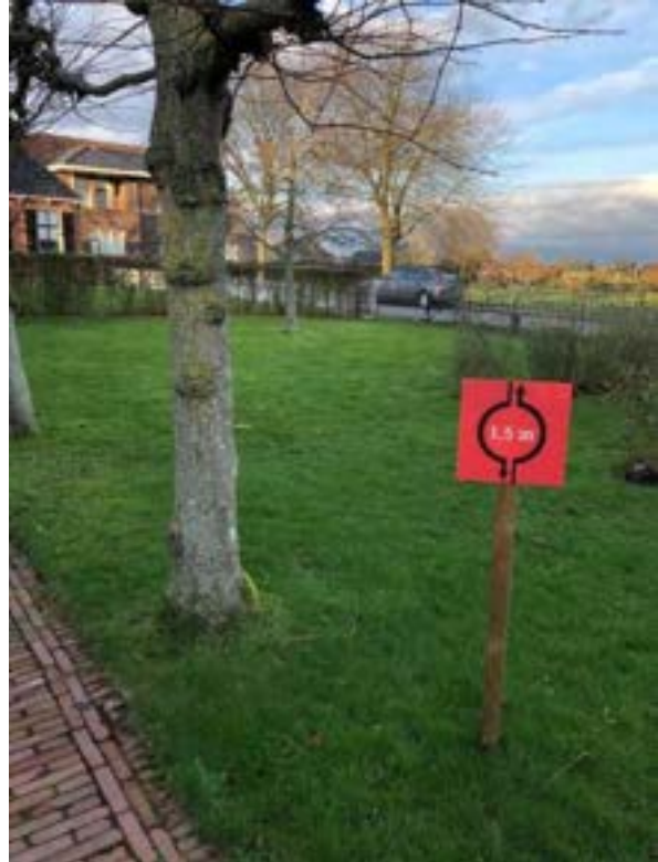
1. de laatste herinneringen aan corona zijn inmiddels verwijderd.

In 2022 is op al deze onderdelen vooruitgang geboekt. In dit verslag keren ze her en der en in samenhang terug.