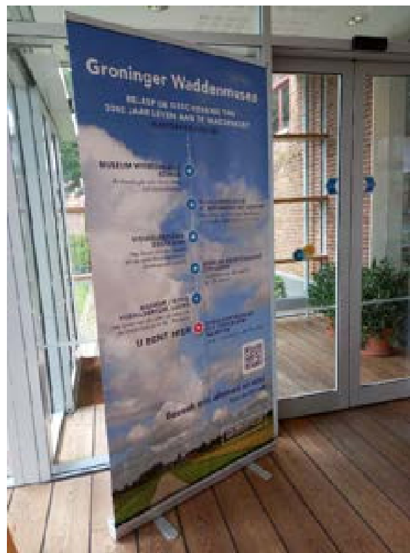
7. De banner waarmee de Waddensea dit jaar aandacht vroegen.