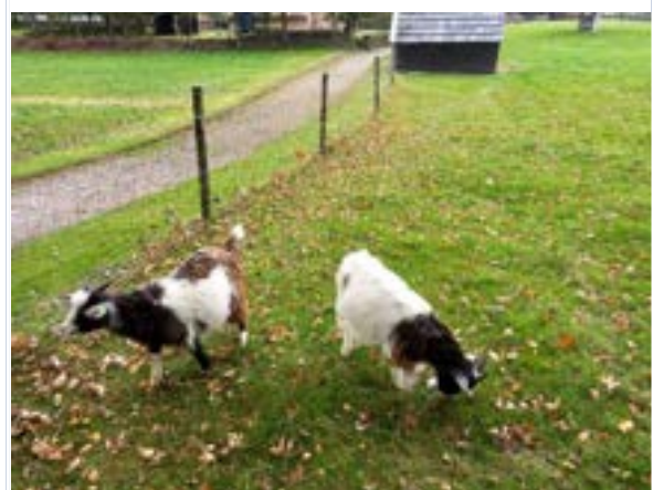
9. Medewerkers en vrijwilligers brachten het jaarlijkse personeelsuitje door in Museum De Spitkeet in Harkema.